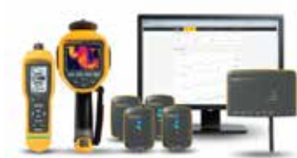
Cámara termográfica Fluke Ti450, Medidor de vibraciones Fluke 805 FC, Control de estado deFluke