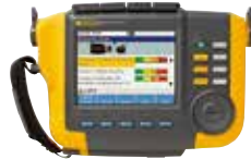
Analizador de vibraciones