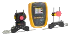
Alineador láser de ejes Fluke 830