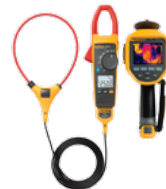
Cámaras termográficas Serie Professional de Fluke, pinza amperimétrica CA/CC de verdadero valor eficaz Fluke 376 FC con iFlex®