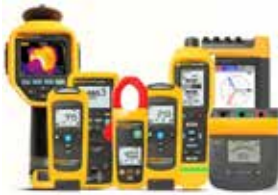
Thermique, électrique et mécanique