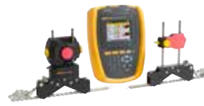
Outil d'alignement par laser