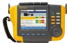
Testeur de vibrations Fluke 810