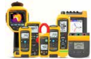
Thermique, électrique et mécanique