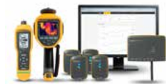
Caméra thermique Fluke Ti450, testeur de vibrations Fluke 805 FC, surveillance d'état Fluke