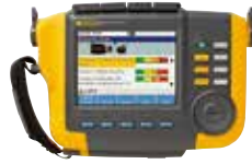
Testeurs de vibrations