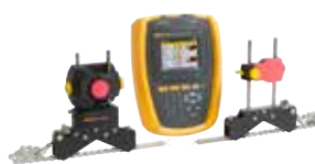
Outil d'alignement d'arbres par laser Fluke 830