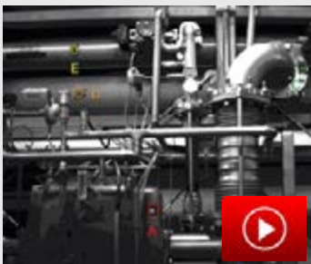
Videobild zur Detailanalyse in einer Biogasanlage

PRÜFTECHNIK führt sowohl videobasierte Schwingungsanalysen an Rohrleitungssystemen, als auch temporäre Schwingungsmessungen mit Sensoren an exponierten Rohrleitungsmesspunkten durch, um unzulässige Schwingungserscheinungen und Abhängigkeiten zur Betriebsweise rechtzeitig erkennen, verstehen und gezielt reduzieren zu können.