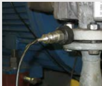
Gezielt positionierter Sensor an einem Kälteverdichter